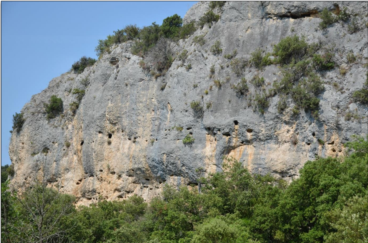
Image 1 : L'une des falaises de la combe de l'Ermitage - Villes-sur-Auzon

Selon les résultats de cette étude et les effets potentiels sur les espèces présentes, des dispositions particulières pourront être prises. Celles-ci pourront prendre la forme de recommandations de bonnes pratiques, d'une limitation de l'activité à certaines périodes de l'année voire même un abandon du projet si des incidences significatives sont attendues.